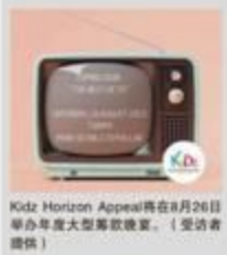
Kidz Horizon Appeal将在8月26日举办年度大型筹款晚宴。