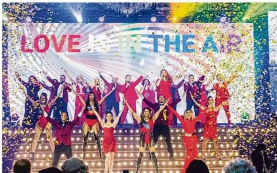
野米剧场需要源源不断的资金才能继续维持运作，因此每年都会举办Wild Rice Ball慈善筹款晚宴。（野米剧场提供）